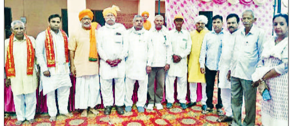
करनाल। आर्य समाज घोघड़ीपुर के वार्षिकोत्सव कार्यक्रम में उपस्थित आर्य सभा के पदाधिकारी व अन्य।

तीन दिवसीय धार्मिक समागम का रविवार को हवन, यज्ञ और भंडारे के साथ हुआ समापन