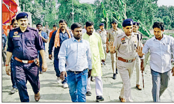
पानीपत। पुलिस अधीक्षक आदि छठ पूजन के लिए घाटों का निरीक्षण करते हुए।