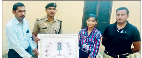
पानीपत। महाराणा प्रताप स्कूल की छात्राएं पुलिस अफसर को पेंटिंग भेंट करते हुए।