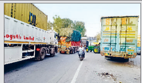
तरावड़ी। मंडी के बाहर सड़क पर ट्रकों व ट्रालियों का लंबा जाम। आज गेटपास नहीं कट पाए, जिससे मंडी में वाहनों का प्रवेश बाधित हुआ और ट्रैक्टर व्यवस्था चरमरा गई। फिखले दो दिन

तरावड़ी (करनाल)। तरावड़ी अनाज मंडी में जाने वाली सड़कों रविवार को जाम की स्थिति बनी रही। रविवार को मंडी में धान की खरीद बढ़ रहने के बावजूद बड़ी संख्या में किसान अपनी फसल लेकर पहुंचे। जिससे सड़कों पर कई किलोमीटर लंबा जाम लगा गया। सुबह से ही ट्रकों और ट्रालियों की लंबी कतारें लगी रहीं। हालात ऐसे बने कि आमजन के वाहन भी जाम में फंसे रहे। मंडी के अंदर प्रवेश को लेकर सबसे बड़ी परेशानी गेट पास प्रक्रिया बनी रही। जानकारी के अनुसार धीमी गति से उठान होने के कारण मंडी धान के बोरो से लंबा लंब था मंडी में आने जाने के तमाम रास्ते बंद हो गये थे जिसकी वजह फिखले दो दिन मंडी बंद रहने का फैसला किया था ताकि दो दिन में उठान होने से मंडी में रास्ते खुल जायेंगे। आज किसान अपनी फसल लेकर आये तो