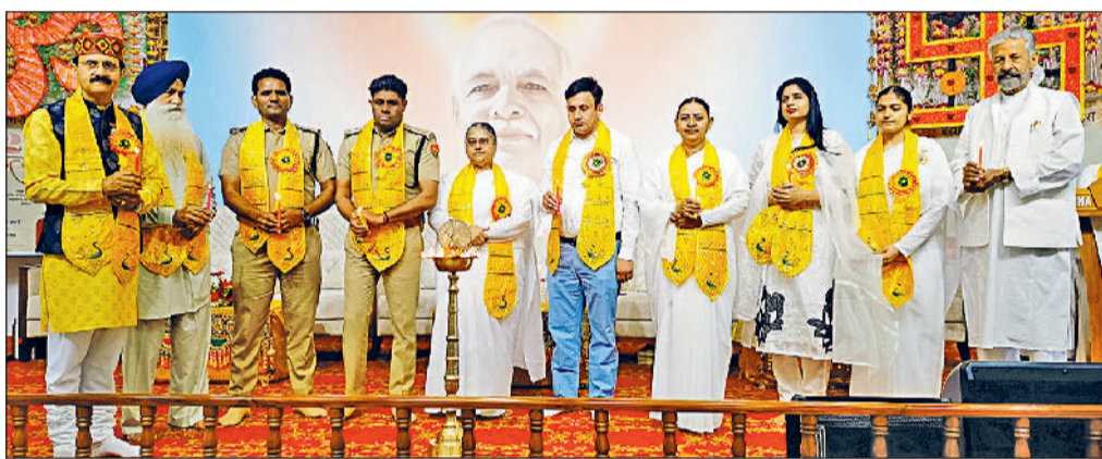
अंबाला। अंबाला शहर के जग्गी कॉलोनी स्थित ब्रह्माकुमारीज सेवा केंद्र में आयोजित कार्यक्रम में मौजूद मुख्यअतिथि।

तनाव का कारण दूसरों में बुराई देखना है तो अपनी बुराई को इस याद की अग्नि में जला देना है। सदा देने का दिया जलाना है दीदी ने सभी को शुक्रिया करने का एक सुंदर प्रयोग कराया।