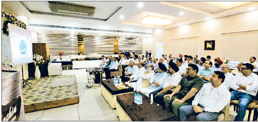
अंबाला। पीएम नरेंद्र मोदी के मन की बात सुनते मंत्री अनिल विज व अन्य।

विज अंबाला छावनी के इंडियन रोलर रेस्टोरेंट में प्रधानमंत्री नरेंद्र मोदी के मन की बात कार्यक्रम के 127वें एपिसोड को शहर के प्रबुद्ध लोगों के साथ सुनने के उपरांत पत्रकारों से बातचीत कर रहे थे। उन्होंने कहा कि हर महीने की तरह इस बार भी प्रधानमंत्री नरेंद्र मोदी के मन की बात सुनने के लिए जगह-जगह लोग इकट्ठा हुए हैं।