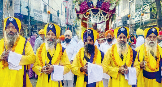
पानीपत। श्री गुरु नानक देव के प्रकाश उत्सव के कीर्तन में भाग लेते हुए पंच प्यारों।

गुरुद्वारा भाई लालो जी सिंह सभा पटेल नगर तहसील कैप द्वारा रविवार को श्री गुरुनानक देव के 556वें प्रकाश उत्सव पर वार्षिक अलौकिक नगर कीर्तन का आयोजन किया गया। जिसमें तहसील टाऊन की प्रमुख धार्मिक एक सामाजिक संस्थाओं ने भाग लिया। प्रभात फेरी के रूप में निकाले गए इस नगर कीर्तन में इलाके के प्रमुख गुरुद्वारों तथा मन्दिरों की प्रभात फेरियां शामिल हुईं। इनमें