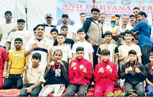
पानीपत। राज्य आर्म्स बॉक्सिंग चैंपियनशिप के विजेता बॉक्सिंग अतिथियों के साथ तथा संस्कृतिक कार्यक्रम पेश करते हुए आरएसएम स्कूल की छात्राएं।