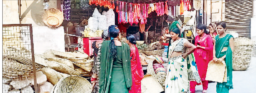
तरावड़ी। छठ पर्व को लेकर सजी दुकानों का दृश्य व पर्व को लेकर महिलाएं पूजा सामग्री की खरीददारी करती हुई।

दिवाली के बाद छठ पर्व को लेकर भगवान सूर्य के उपासना के लिए प्रवासी परिवारों की तैयारी चल रही है।