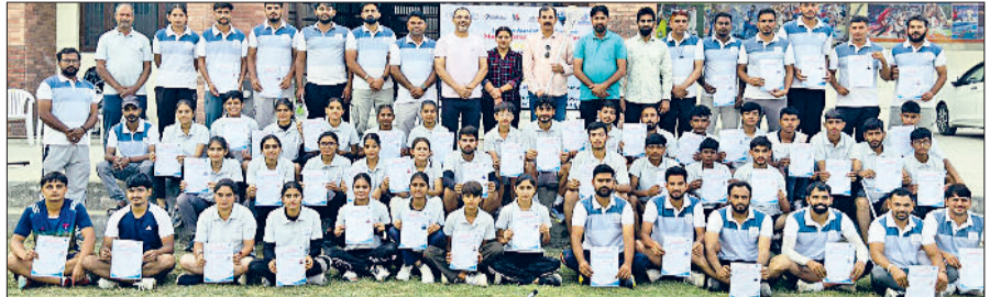
पानीपत। आर्य कॉलेज में लैक्रोस संघ के पदाधिकारी, कोच, खिलाड़ी आदि।