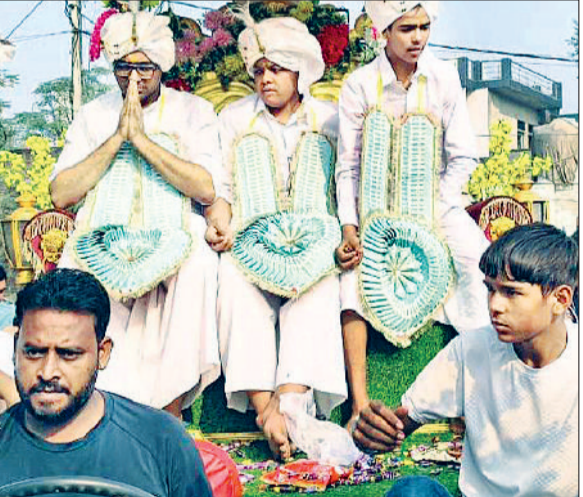
पानीपत। पानीपत के गांव राजाखेड़ी में रथ पर सवार जैन दीक्षार्थी।